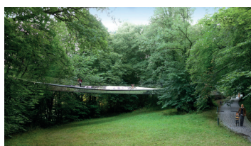
Bilder aus dem Guide OAI Références 2022, wo die Planer dieser Projekte zu finden sind. cf. www.guideoai.lu